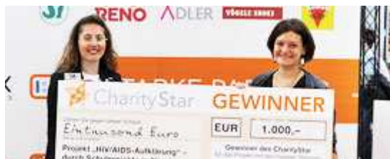
Charity Star 2010

Trierer Str. 63, 54298 Igel www.suni-ev.de kontakt@suni-ev.de