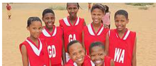
Bild 1: Einige Spieler des Fußballteams der Mphe Thuto Schule mit den neuen Trikots aus Deutschland / Bild 2: Das Netballteam der Mphe Thuto Schule mit neuen Trikots

Auch im kommenden Jahr möchten wir weiterhin gute und effektive Arbeit in Namibia und Deutschland leisten, um unsere Ziele zu erreichen. Das Jahr 2011 wird ein Jahr der Festigung und Stabilisation von Suni e.V. Wir freuen uns, es mit ihnen zu bestreiten.