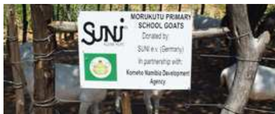
Bild: Überprüfung des Ziegenprojektes an der Morukutu Primary School

Obwohl unsere Arbeit als sehr positiv angesehen wird, gibt es weiterhin verbesserungswürdige Punkte, die wir zusammen mit den Kindern, Jugendlichen und Lehren unserer Partnereinrichtungen aufgedeckt haben. Ein wichtiger Punkt war die Qualifikation der Praktikanten, was dazu geführt hat, eine neue und transparente Einteilung zu erarbeiten. Zudem haben wir ein neues Qualitätsmanagement für alle Projekte von Suni e.V. entwickelt und werden es ab 2011 umsetzen.